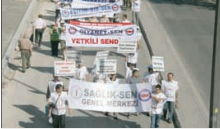
İSTANBUL-2 NOLU ŞUBE

Bunun yanı sıra; tüm sözleşmeli sağlık çalışanlarının mutlaka kadroya geçirilmesi gerektiğini, en fazla sözleşmeli sağlık çalışanının İstanbul’da olduğunu belirterek bu konuda da en fazla sorunun İstanbul’da yaşandığını ifade ettiler.