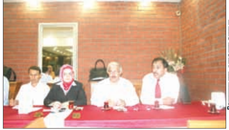
İSTANBUL-1 NOLU ŞUBE