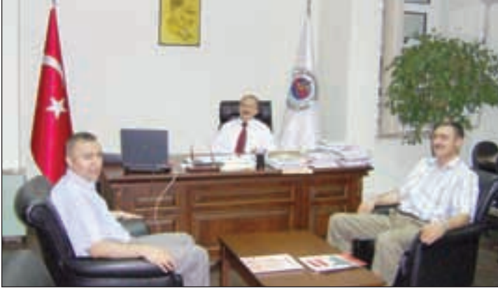
ANKARA 2 NOLU ŞUBE